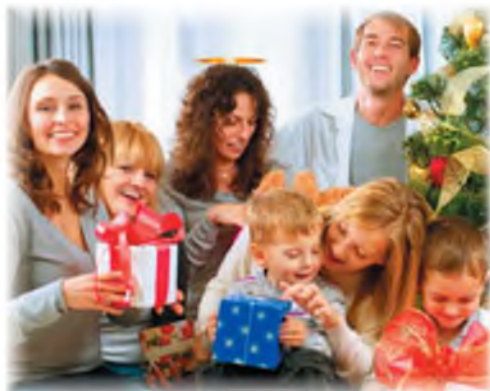
Встречаем Новый год

В. Напиши небольшое сочинение на тему «Событие в семье» (пять-шесть предложений). Можешь использовать одну из фотоиллюстраций.