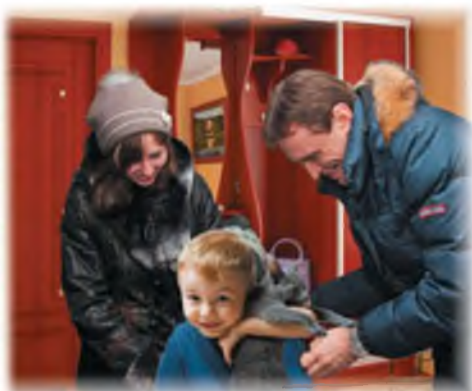
Новый член семьи