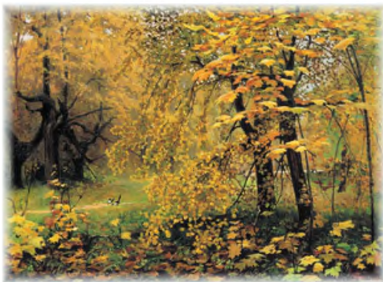
И. Остроухов. Золотая осень

Рассмотри репродукцию картины И. Остроухова «Золотая осень». Как ты считаешь, может ли она быть иллюстрацией к данному тексту? Аргументируй свою точку зрения.