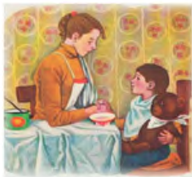
Н. Седулина. Иллюстрация к рассказу В. Драгунского «Друг детства»

А я не знал, что со мной, я долго молчал и отвернулся от мамы, чтобы она не догадалась, что со мной, и я задрал голову к потолку, чтобы слёзы вкатились обратно, и потом, когда я скрепился немного, я сказал: