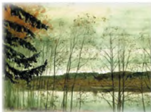
И. Левитан. Осень

Прочитай. Описанием какой репродукции могут быть эти стихотворные строки?