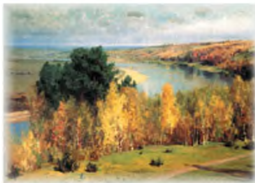
В. Поленов. Золотая осень