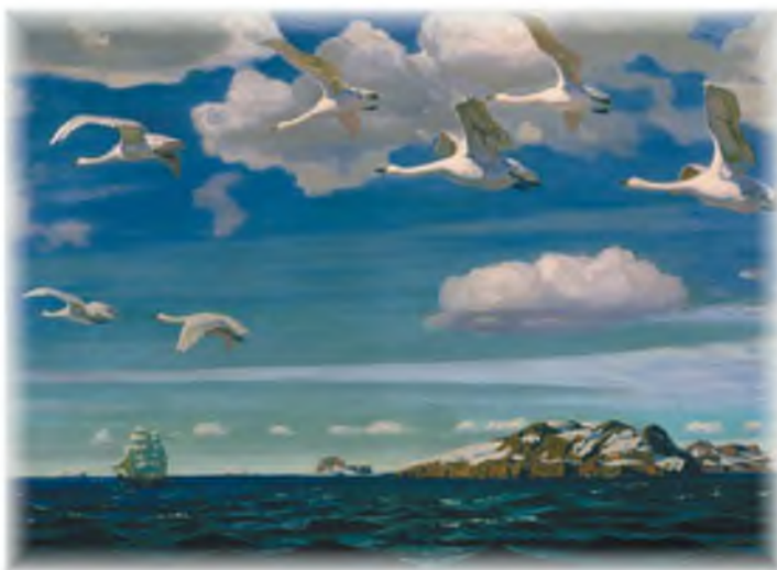
А. Рылов. В голубом просторе

Обязательно используй эпитеты, сравнения, метафоры. Можешь воспользоваться репродукцией картины А. Рылова «В голубом просторе».