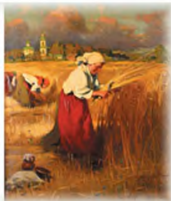
А. Маковский. Жатва. Труд

370. Проверь себя! А. Составь список главных слов урока.